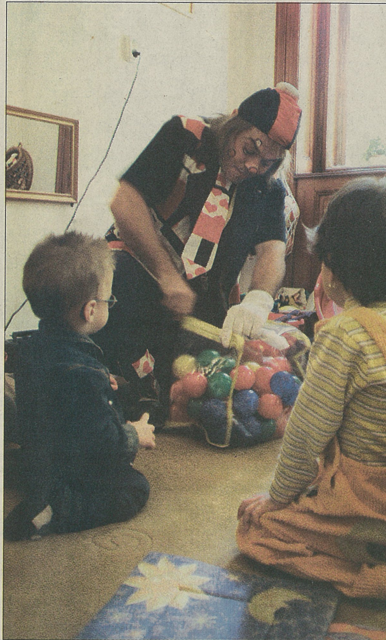
Tüske bohóc és a „csodagyerekek”. Adományokból és a különböző pálváza-

A szülők, a gyerekek és az adományozók most együtt ünnepelnek. Tüske papa, a bohóc számtalan apró ügyességi já-